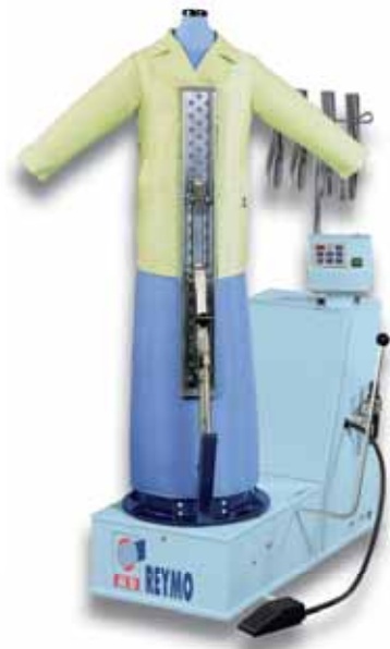
M-781 Castello Baby

GFV нормальный, утюг J 2 - Пистолет паровой, Пульверизатор воды, Взаимозаменяемые и особенные корпуса.