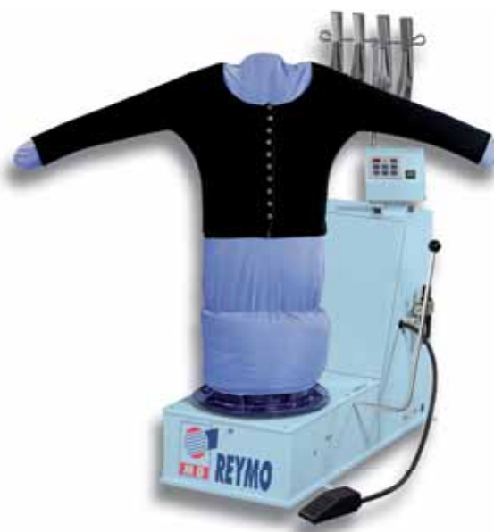
M-781 Castello MA