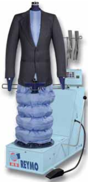
M-781 Castello Wet

GVF Groupe fer vapeur, pistolet vapeur, pistolet à eau, poupées alternatives interchangeable avec la poupée standard universelle.