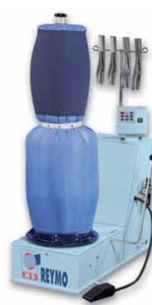
M-781 Castello GO