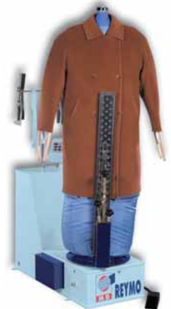
M-781 Castello Maxi